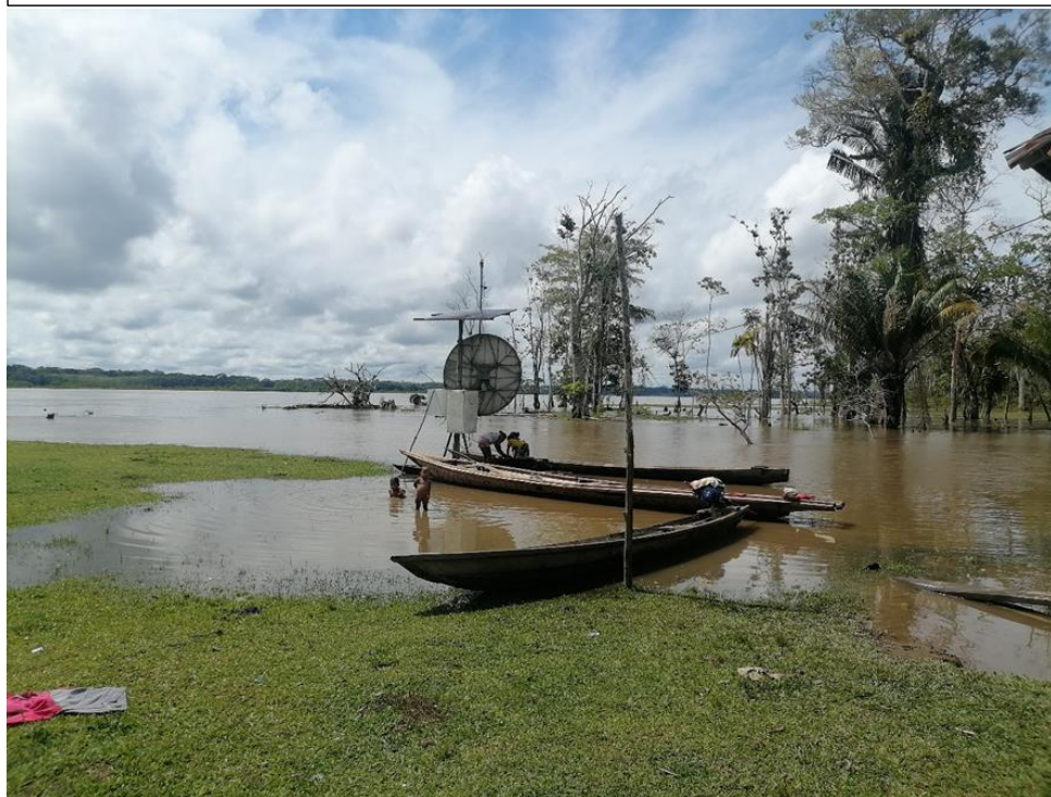
FIGURA N°03: INGRESO DE LAS AGUAS DEL RÍO NAPO POR DESBORDE, AFECTANDO A LA COMUNIDAD NATIVA NUEVA LIBERTAD.