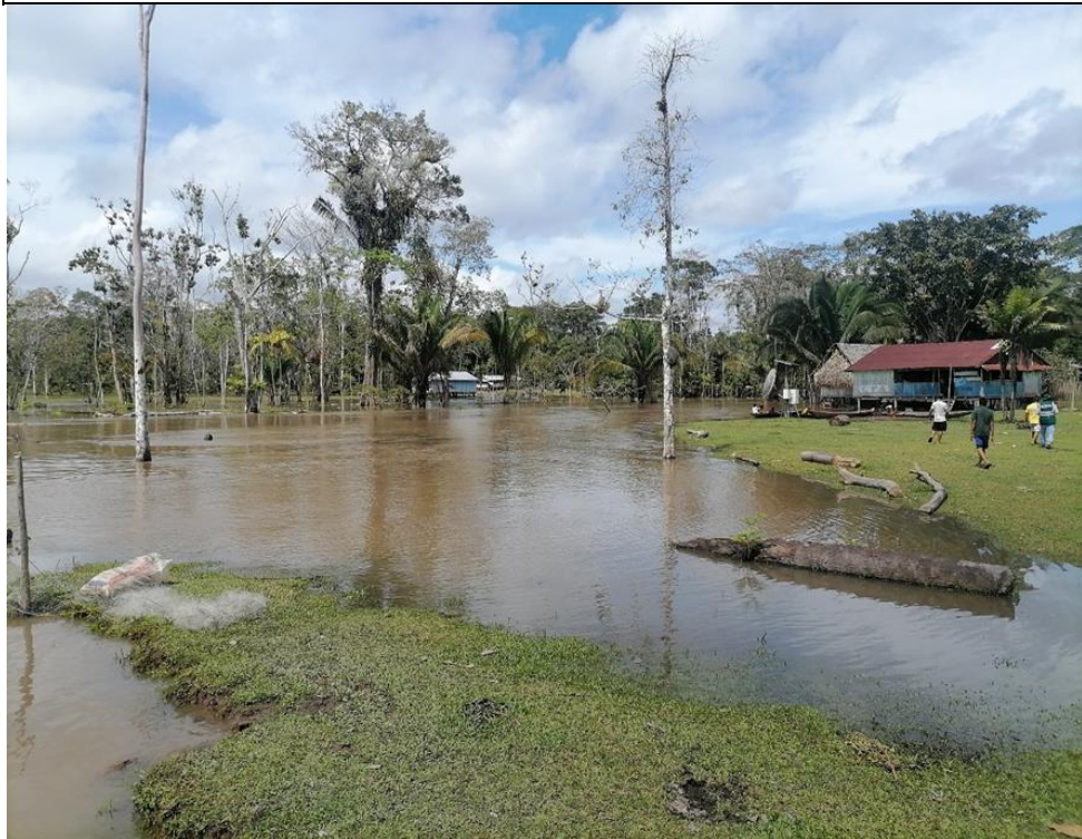
FIGURA N°01: COMUNIDAD NATIVA NUEVA LIBERTAD, AFECTADA POR INUNDACIÓN DEL RÍO NAPO