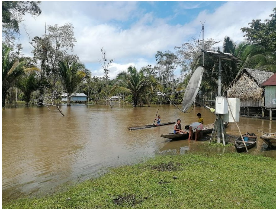
FIGURA N°02: VIVIENDAS E INFRAESTRUCTURAS DE SERVICIO AFECTADAS POR LA INUNDACIÓN DLE RÍO NAPO.